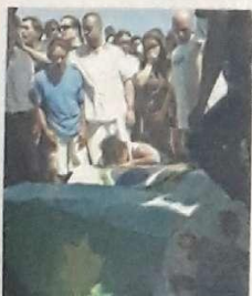
Amigos e parentes prestam o último adeus ao cartunista

Acostumada a enviar intercambistas, Goiânia também recebe curiosos estrangeiros. Sem grande tradição em receber gringos, a Capital está cheia de intercambistas vindos dos lugares mais diferentes. E como eles vivem por aqui? DM Revista, capa