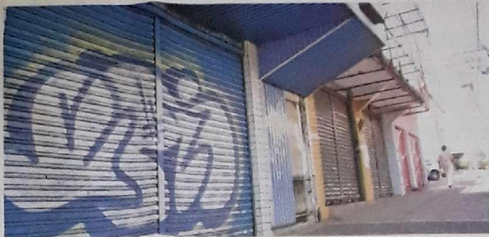
Comerciantes da Anhanguera são obrigados a fechar as portas mais cedo. Violência cresce na avenida