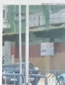
Por falta de segurança, comerciantes fecham portas