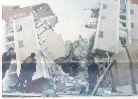
Em Concepción, policiais trabalham na busca de sobreviventes em prédio

O terremoto de 8,8 graus que atingiu o Chile na madrugada de ontem deixou mais de 300 mortos, de acordo com levantamento divulgado às 23h, após o fechamento das páginas internas do DM. 1,5 milhão de casas são destruídas. Tremor