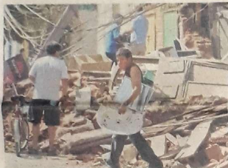
Destruição na cidade de Talca depois do terremoto que atingiu o Chile