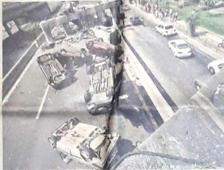
Veículos tombados e destruídos numa das avenidas da capital Santiago