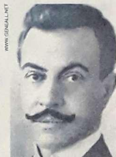
Ministro José Pires do Rio